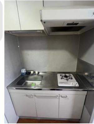
キッチン (シャワーヘッド新品です♪) (ガス台新品です！)